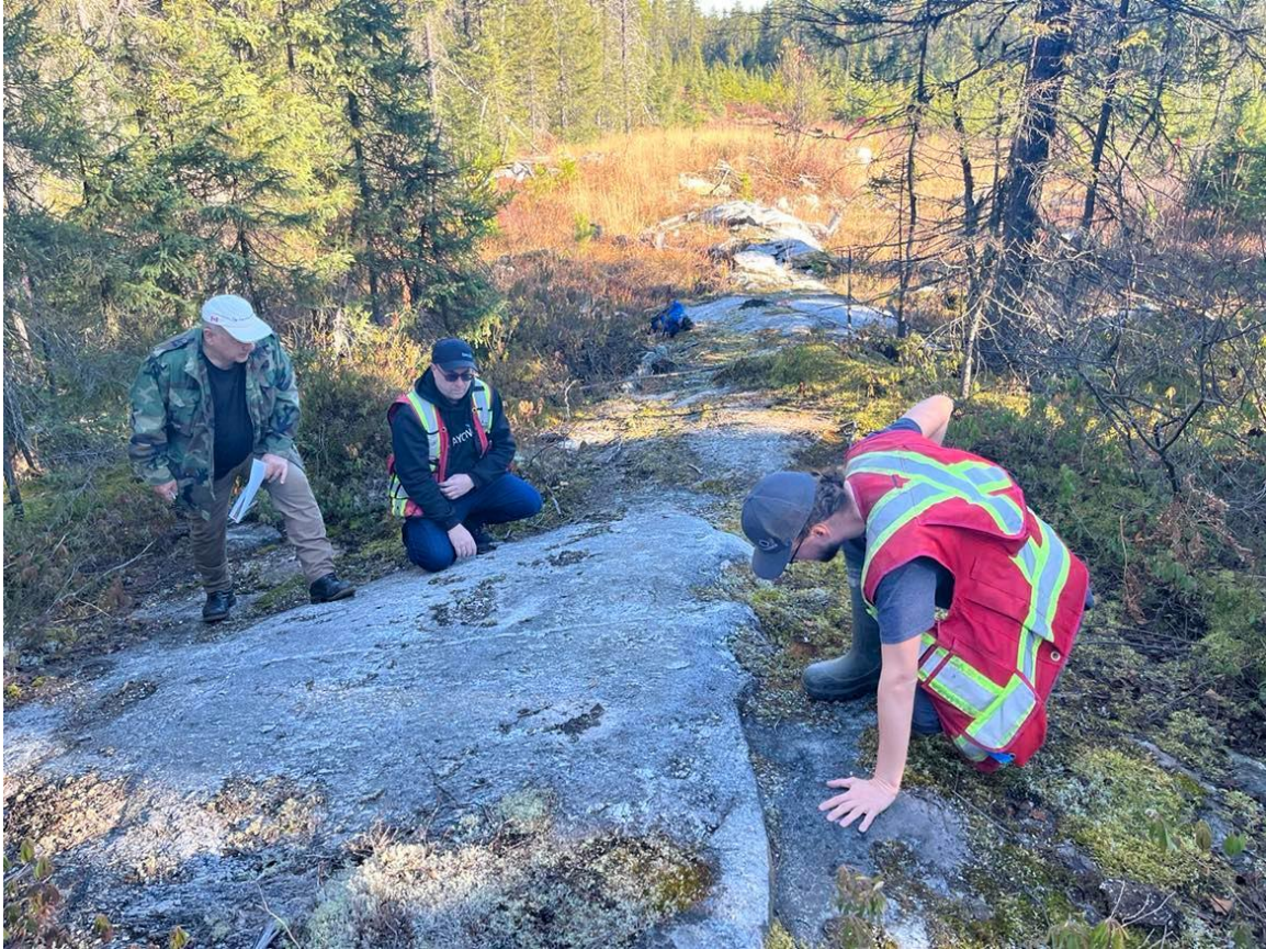
Figure 2: Projet Vallée – pegmatite affleurante